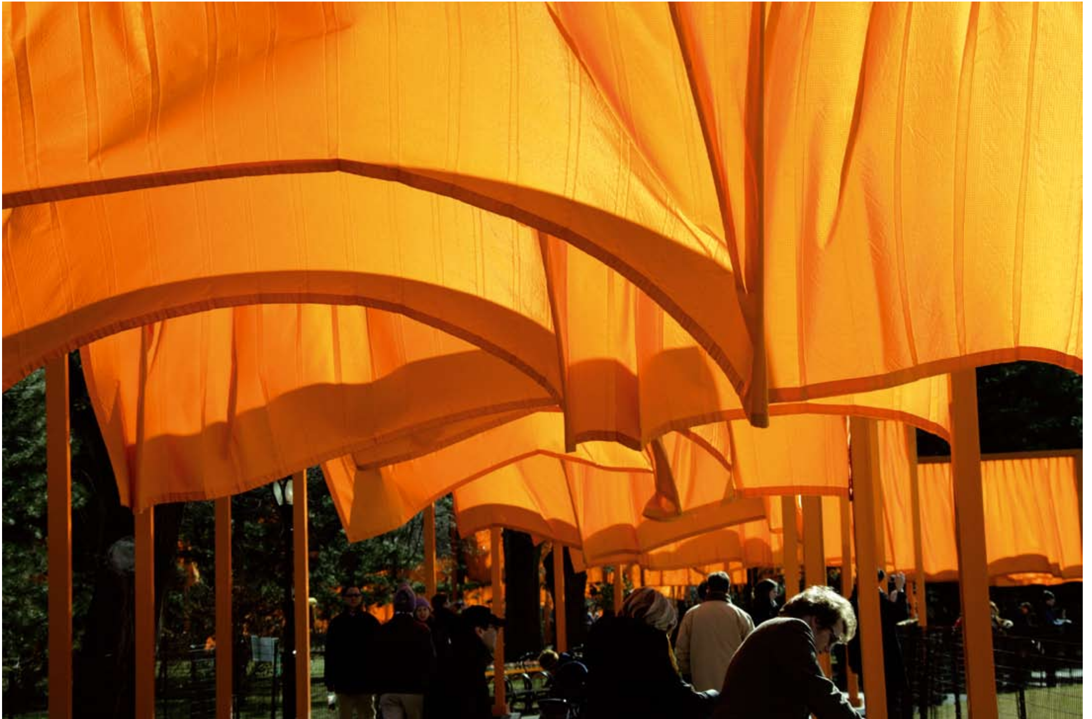
Volz, Christo e Jeanne-Claude , The Gates , Central Park, New York, Usa, 2005, fotografia originale su Dibond, cm. 70 x 100, 8 esemplari