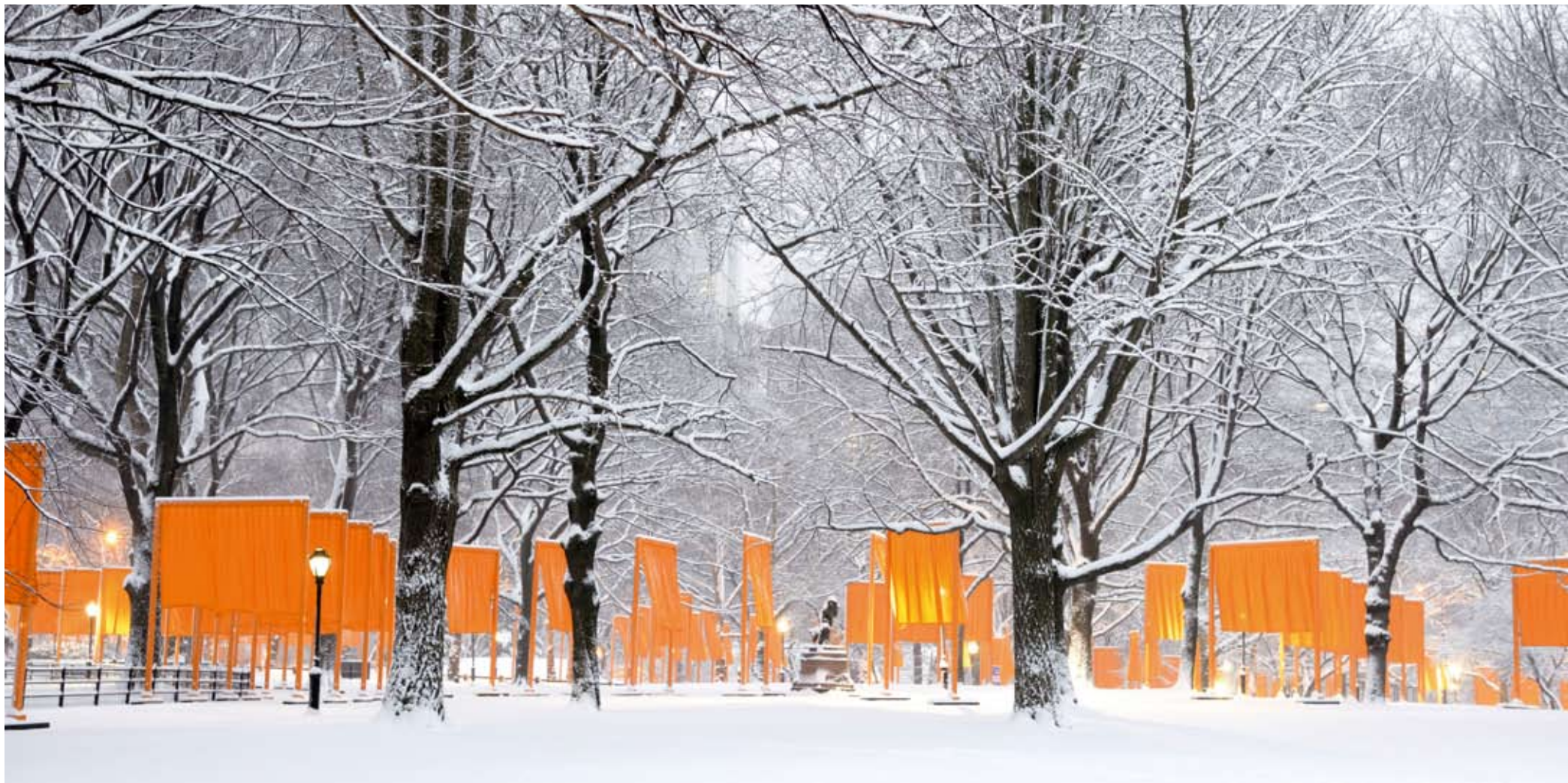
Volz, Christo e Jeanne-Claude , The Gates , Central Park, New York, Usa, 2005, fotografia originale su Dibond, cm. 80 x 170, 4 esemplari