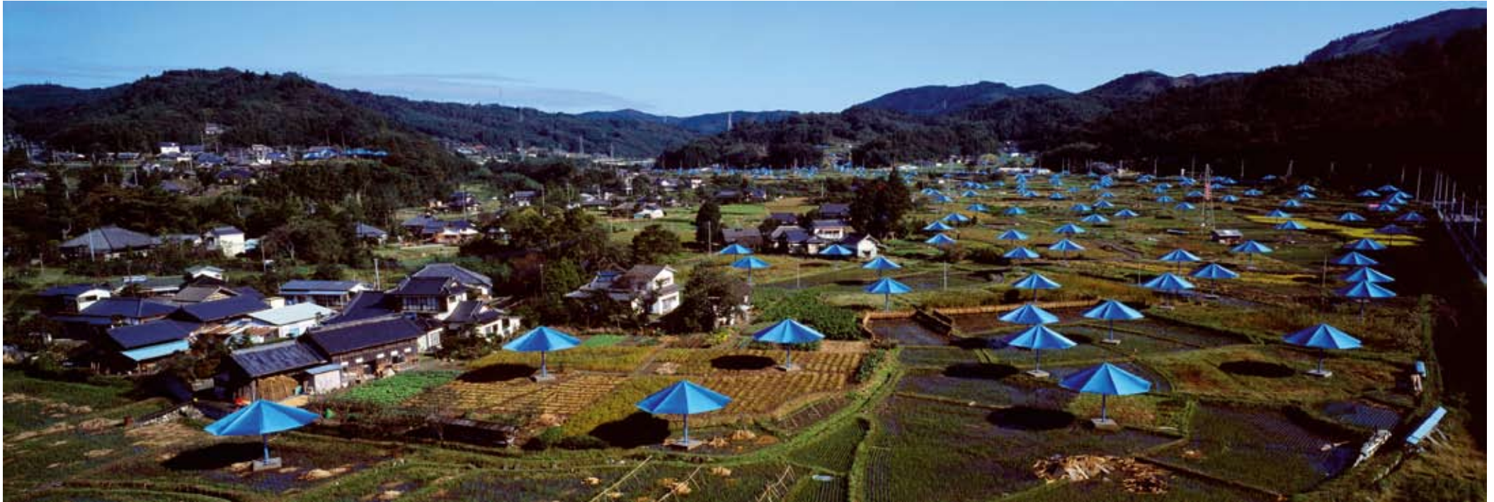
Volz, Christo e Jeanne-Claude , The Umbrellas , Ibaraki, Japan, 1991, fotografia originale su Dibond, cm. 100 x 300, 3 esemplari