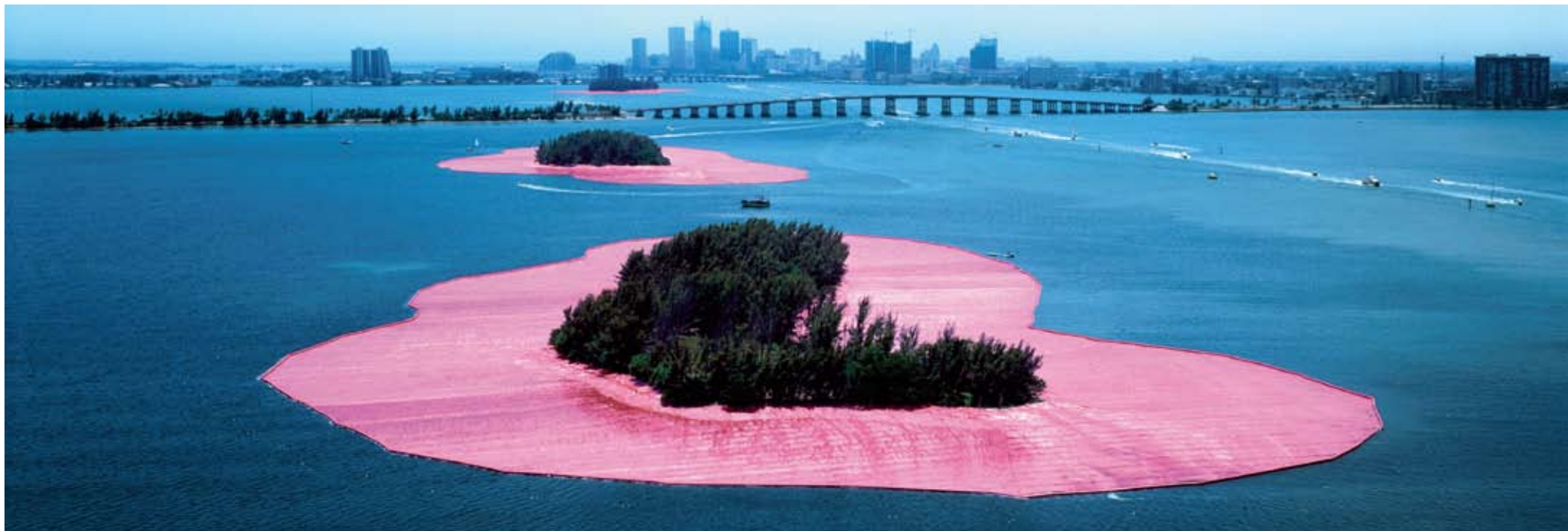
Volz, Christo e Jeanne-Claude , Sourrounded Islands , Biscayne Bay, Greater Miami, Florida, 1983, fotografia originale su Dibond, cm. 100 x 300, 3 esemplari