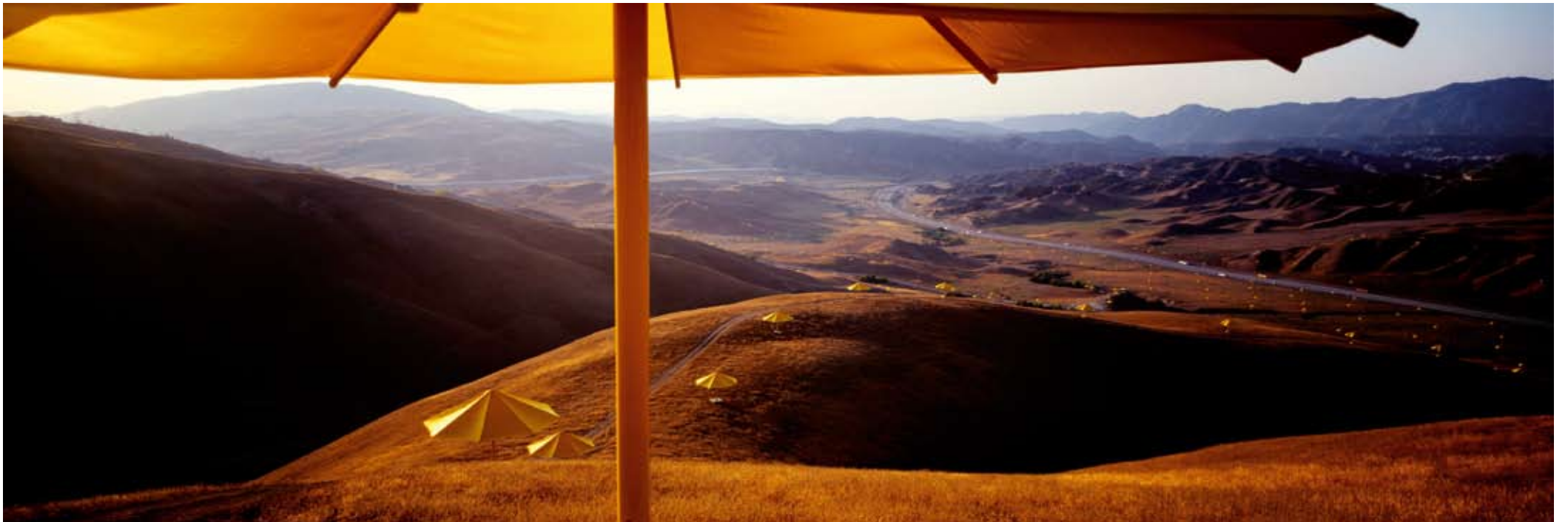
Volz, Christo e Jeanne-Claude , The Umbrellas , California, Usa, 1991, fotografia originale su Dibond, cm. 100 x 300, 3 esemplari