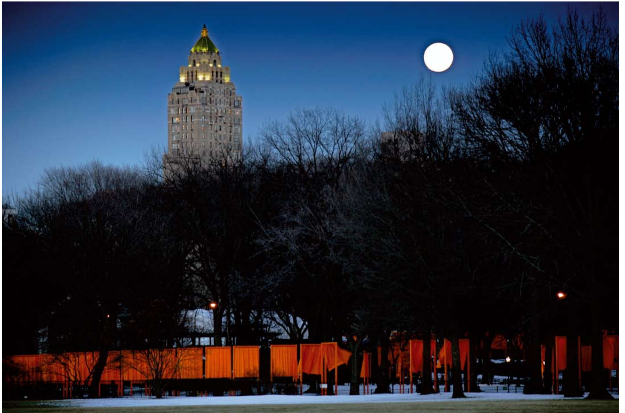
Volz, Christo e Jeanne-Claude, The Gates , Central Park, New York, Usa, 2005, fotografia originale su Dibond, cm. 70 x 100, 8 esemplari