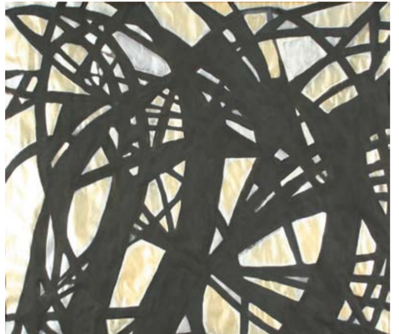
Francesco Burni, Le vie della Mille Miglia, 2008, acrilico su carta, cm 60 x 70