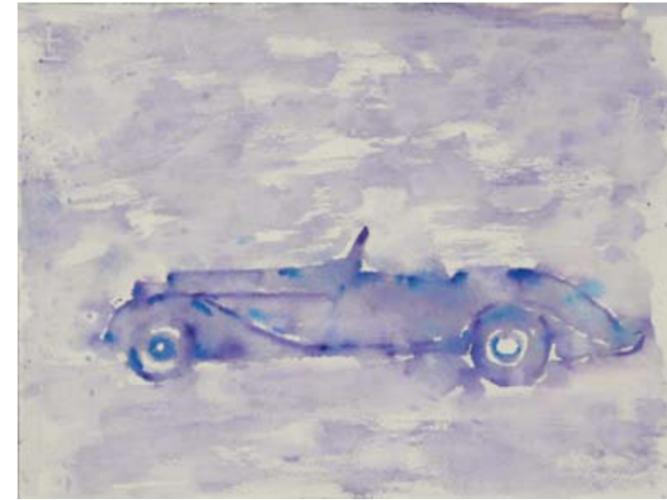
Sergio Dotti, Auto azzurra, 2008, acquarello, cm 29 x 38,5