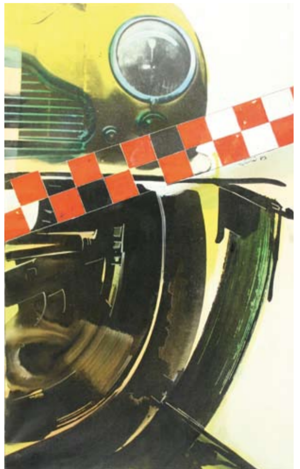
Gianni Bertini, La luce di Polinestra, 1983, Mec-Art, cm 80 x 50