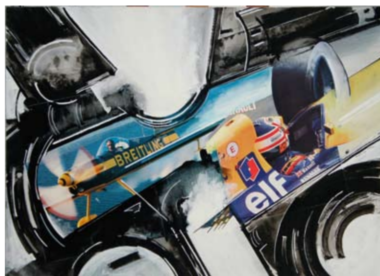
Gianni Bertini, La fuga di Patrolo, 1992, tecnica mista, cm 51 x 71