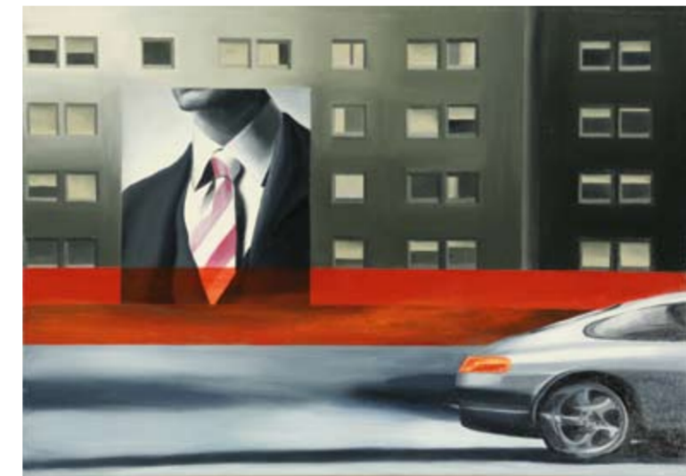
Bruno Gentile, Arrivo con la 911, 2007, olio su tela, cm 50 x 70