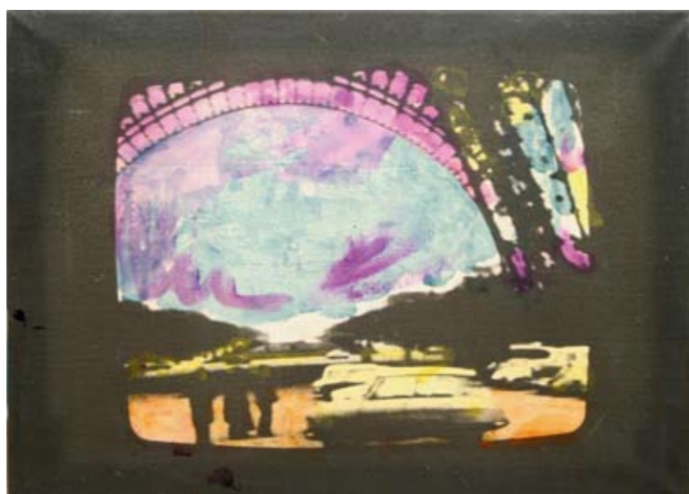
Mario Schifano, televisore, anni '70, smalto su tela emulsionata, cm 48 x 68