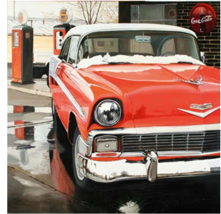
Claudio Filippini, U.S.A., 2007, smalto su tela, cm 100 x 100