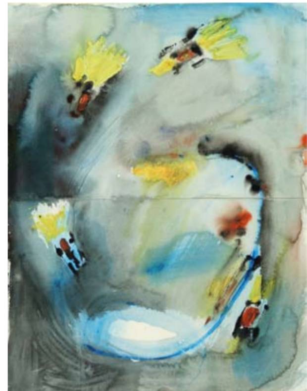
Angelo Valli, Ventagli di luce, circuiti d'asfalto e di diamante, vertigine, 2008, acquarello, cm 36 x 50