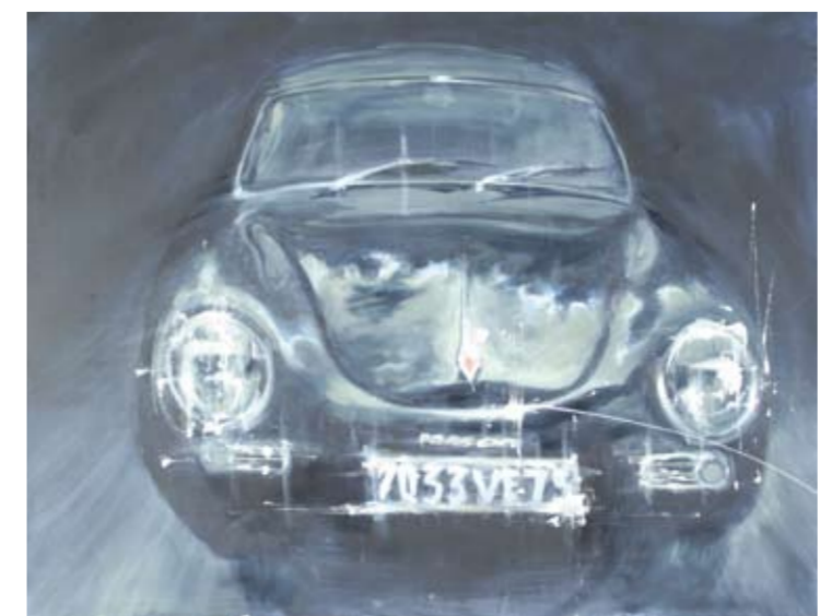
Tom Porta, Porsche, 2008, acrilico su tela, cm 60 x 80