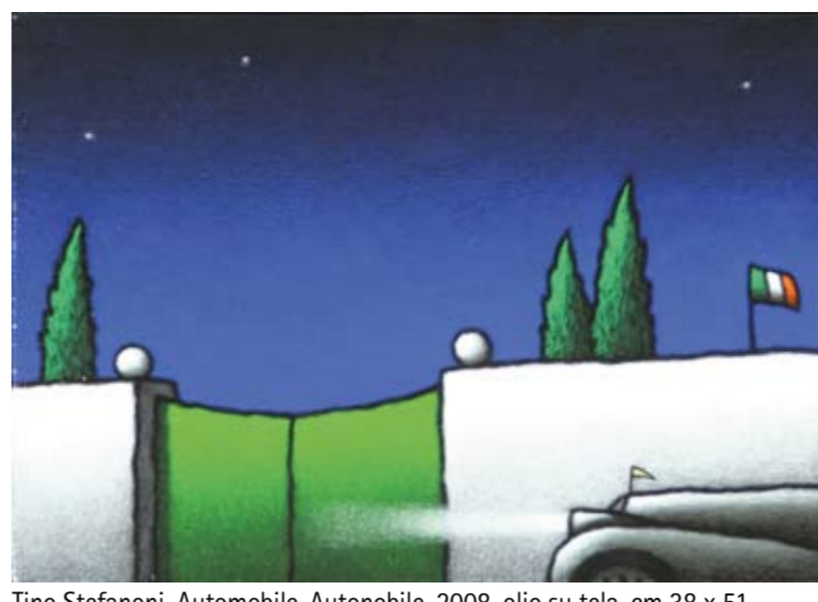
Tino Stefanoni, Automobile-Autobus, 2008, olio su tela, cm 38 x 51