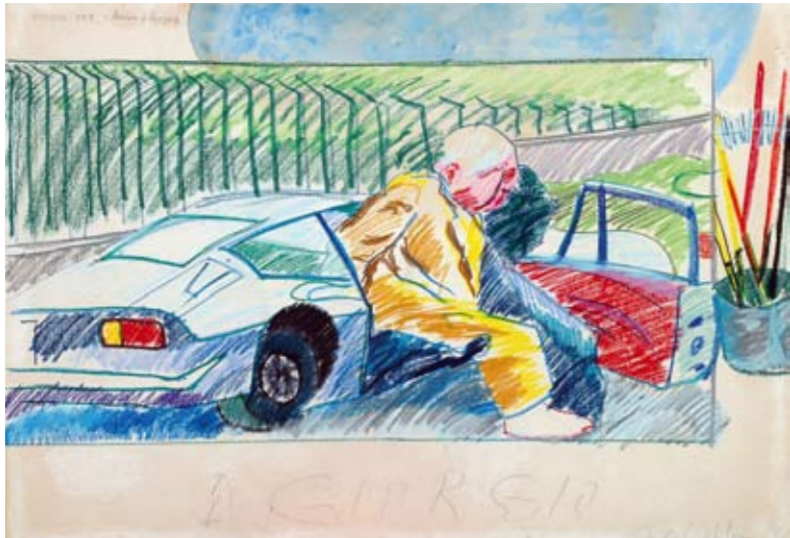
Aldo Mondino, Arrivo a Verona di Giorgio de Chirico, 1971, tecnica mista, cm 50 x 70