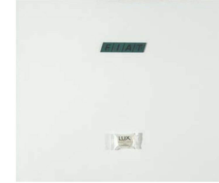
Sarenco, Fiat Lux, dittico, 2006, collage su tela, cm 50 x 60 cad.