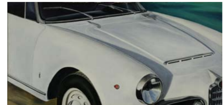
Bruno Gentile, Angelo azzurro, 1996, olio su tela, cm 50 x 85