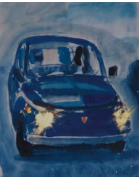
Bonomo Faita, Senza titolo, 2007, Tecnica mista su fotografia. cm 9 x 7