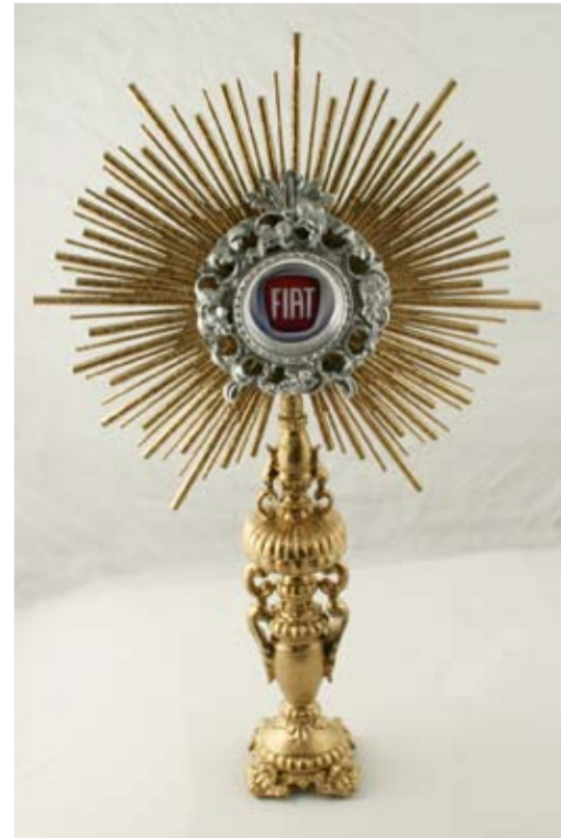
Andrea Lanzi, Ostensorio, 2007, tecnica mista, cm 68 x 41