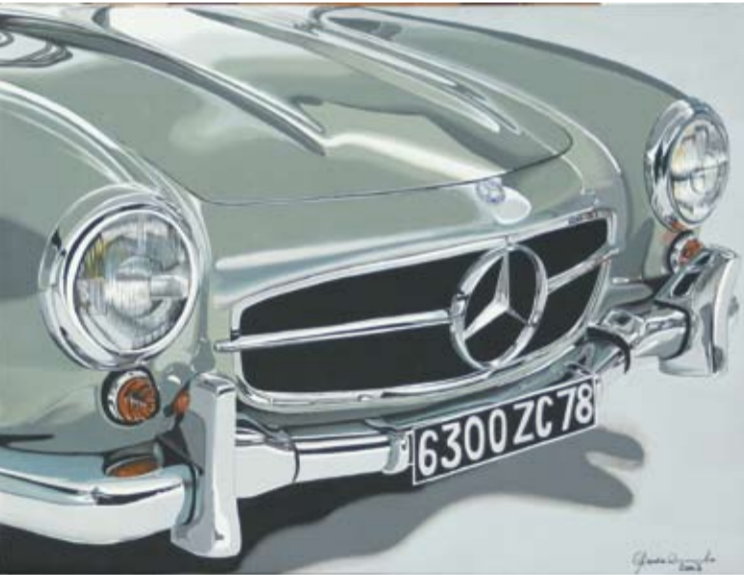
Grazia Gentiloni, 300 SL, 2007, smalto su tela, cm 30 x 40