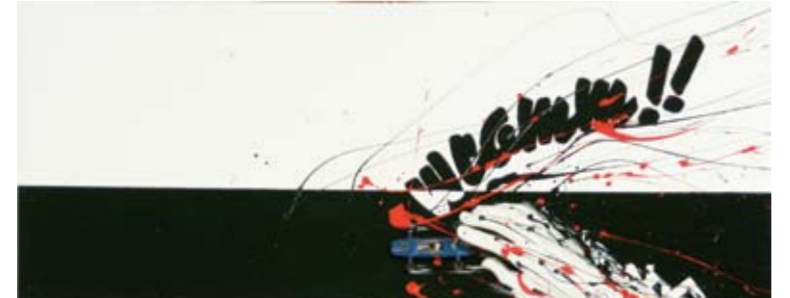
Maurizio Marini, Rimembranze dell'infanzia, 2004, tecnica mista, cm 50 x 100