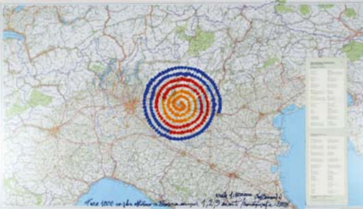
Eros Bonamini, Mille Miglia, 2008, tecnica mista su carta, cm 69,5 x 120